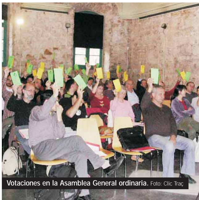
Votaciones en la Asamblea General ordinaria.

Todas las decisiones se tomaron por unanimidad. Los documentos relativos al ejercicio 2005 y el plan de trabajo y presupuesto del presente año ya están disponibles en nuestra página web: www.coop57.coop . #