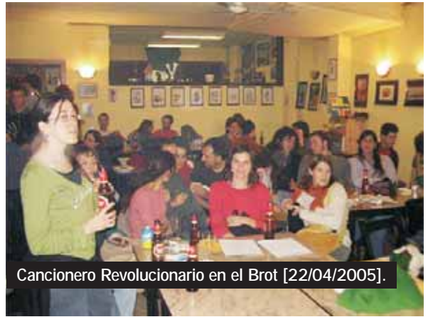
Cancionero Revolucionario en el Brot [22/04/2005].

Algunas de estas entidades ya habían seguido de cerca el proceso de constitución de 57-Aragón, cuya experiencia positiva ha facilitado y agilizado que 57 Madrid ya sea un hecho y que pronto empiece a ser un instrumento útil y una realidad práctica y solidaria. #