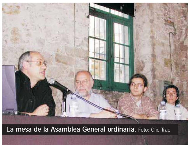
La mesa de la Asamblea General ordinaria.