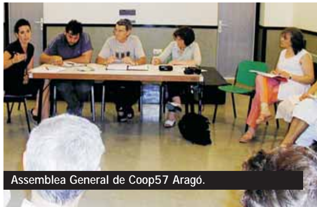
Asamblea General de Coop57 Aragón.

En lo referente al plan de trabajo y presupuestos se ratificaron los acuerdos tomados en Barcelona y se aprobaron los siguientes puntos relativos a Aragón: