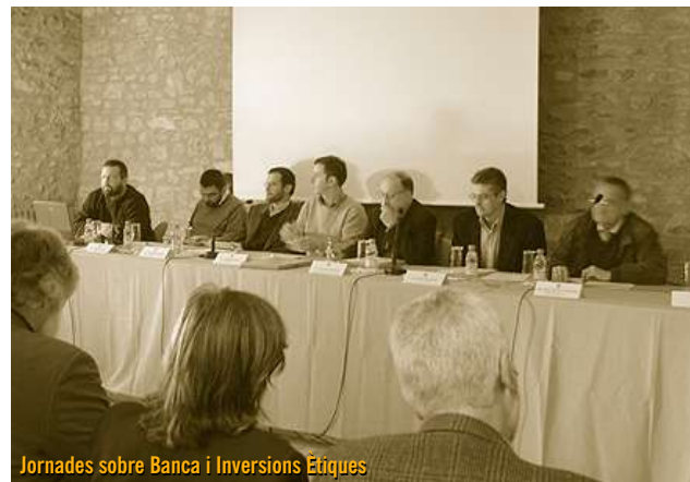
Jornades sobre Banca i Inversions Ètiques