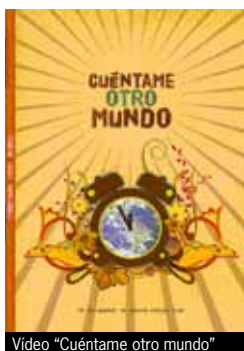
Video "Cuéntame otro mundo"

Durant el primer semestre, s'han associat a Coop57-Aragó l'associació El Cantero de Torrero, espai plural que aplega inquietuds ecologistes, feministes, sindicals i antifeixistes del barri saragossà de Torrero, així com la cooperativa d'iniciativa social 2 Avia, dedicada a la detecció, assessorament i acompanyament terapèutic de persones amb malalties mentals i discapacitats psíquiques i/o físiques. Alhora, 28 persones més han esdevingut sòcies col·laboradores de la secció aragonesa i s'han recollit més de 140.000 euros en noves aportacions voluntàries.