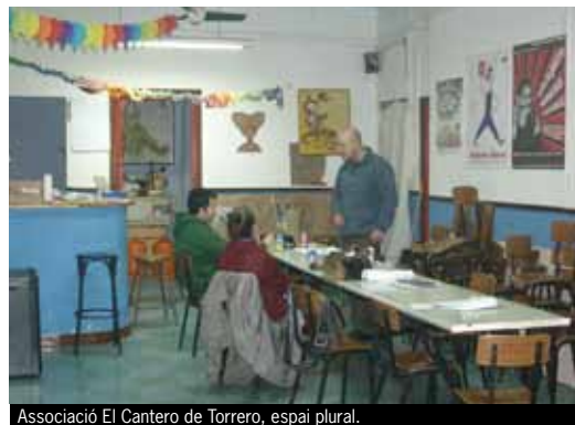
Associació El Cantero de Torrero, espai plural.

Durant aquest semestre, Coop57-Aragó , integrada per 30 entitats sòcies i 168 persones col·laboradores, ha realitzat tres assemblees generals: una per impulsar una campanya social de captació d'estalvi que encara es perllonga, una altra