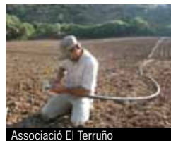
Associació El Terruño

En allò relatiu a les operacions aprovades, es va concedir un préstec de circulat, a 9 mesos i per valor 24.000 euros, a la fusteria cooperativa Almenara. I es varen aprovar dos préstecs a llarg termini. Un, a favor d'El Terruño, per valor de 12.000 euros i a un termini de 54 mesos per la posada en marxa d'un hort que produeixi hortalisses ecològiques i generi ocupació de qualitat. L'altre, de 60.000 euros a 23 mesos, és a favor de la Fundació Girasol i finança el conveni subscrit amb la Conselleria d'Igualtat i Benestar Social per al funcionament d'una comunitat terapèutica a Arcos de la Frontera.