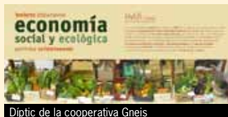
Diptic de la cooperativa Gneis

La secció madrilenya de Coop57 , formada ja per 28 entitats i 99 persones sòcies, ha aprovat en els darrers sis mesos dos préstecs a curt termini i dos avançaments de subvenció. Els préstecs han estat destinats a la nova cooperativa sòcia Acais Comunidad y Desarrollo, per un valor de 63.000 euros a 9 mesos, per finançar el contracte contret amb l'Ajuntament de Madrid per desenvolupar un Pla Integral de Convivència als instituts públics del districte de Villaverde. L'altre préstec, per valor de 60.000 euros a un termini de 8 mesos, és per a la cooperativa madrilenya Dinamia, per a finançar el contracte amb els Serveis Socials de l'Ajuntament de Madrid per a gestionar el 'Programa d'Atenció Integral a les dones víctimes d'exploració sexual (tracta i prostitució)'. Alhora, el consell de secció va aprovar una operació de circulat de 18.000 euros per a la cooperativa Heliconia i un altre de 31.000 euros per a l'associació La Kalle, per afrontar l'endarreriment municipal en abonar el programa, ja realitzat, de Formació Prelaboral en l'àmbit del Comerç i la Distribució.