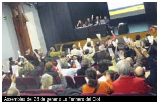
Assemblea del 28 de gener a La Farinera del Clot

El 28 de gener el Centre Cultural La Farinera del Clot (Barcelona) va acollir l'Assemblea General Ordinària que va aprovar el tancament de l'exercici 2008, on s'ha experimentat de nou un creixement estable, sostingut i sostenible. L'augment de la base social en un 29%, l'increment del 20,49% en les aportacions dels socis col·laboradors i el creixement de l'activitat en un 24,82%, respecte l'11% experimentat el 2007, en donen bona fe. En un exercici 2008 on es van concedir 132 préstecs (102 l'any 2007) per un valor total de 3.527.607 euros, respecte els 2.826.155 euros concedits el 2007.