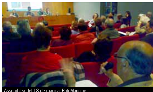
Assemblea del 18 de març al Pati Manning

A la mateixa assemblea també es va aprovar per unanimitat el pressupost i pla de treball per al present any, així com el protocol de prioritització en la concessió de préstecs per afrontar en millors condicions l'actual conjuntura de crisi. L'intens debat produït al voltant del punt que tractava l'evolució del projecte Fiare va motivar, tanmateix, la convocatòria d'una Assemblea Extraordinària amb caràcter monogràfic. Aquesta es va celebrar el 18 de març al Pati Manning de la Diputació de Barcelona, amb un elevat grau de participació –93 entitats sòcies i socis col·laboradors– i va cloure reeixidament consensuant els criteris de participació de Coop57 com a soci transversal. Així, Coop57 s'implicarà activament en el procés de construcció de la futura caixa cooperativa. Participarà plenament en la vertebració social i en la recollida de capital, però sense prendre part en l'operativa. Respecte a la concreció dels recursos que aportarà Coop57 no es realitzaran, per ara, més aportacions a fons perdut; es fixaran els mecanismes per a que la base social de Coop57 es vegi reflectida en la futura banca ètica; i es demandarà que siguin tingudes en compte les realitats nacionals.