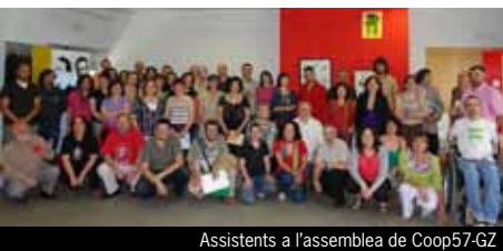
Assistents a l'assemblea de Coop57-GZ

La secció territorial gallega es va constituir el maig passat a Santiago de Compostel·la