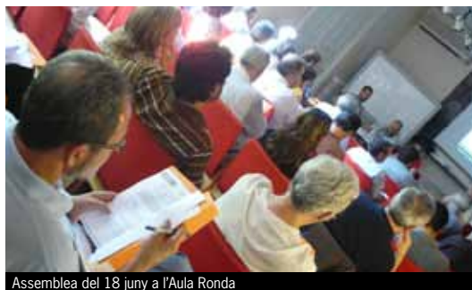
Assemblea del 18 juny a l'Aula Ronda