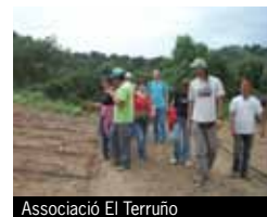
Associació El Terruño