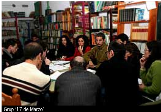
Grup '17 de Marzo'

Tres noves entitats s'han associat aquest semestre a Coop57-Andalusia : es tracta de la Fundació Girasol (fundada el 1984 i pionera en l'atenció social a les addiccions), l'Associació de Productors i Consumidors 'El Terruño' (impulsada per jornalers del SOC de Morón de la Frontera per generar un projecte d'agricultura ecològica tradicional) i el Grup '17 de Marzo' (associació de juristes andalusos en de-